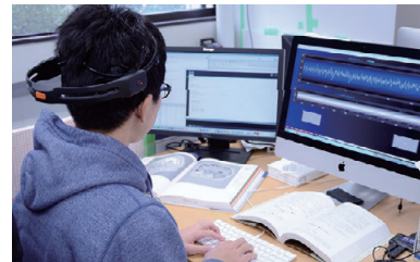
プログラム理解時の脳活動計測に関する研究 Brain Activity Measurement during Program Comprehension in Pre-Research Projects

情報システムコースでは、情報機器を自在に扱え、それらの統合システムの設計・開発能力に優れた技術教育は勿論のこと、高度な情報システムに関する開発知識と実行力を備えた技術者の育成を目標としている。そのため、先端的なソフトウェア設計・計算機ハードウェアなど各分野の科目をバランス良く履修させ、その上に高度な情報システム技術開発に必要な知識と解析能力を教授する。また、社会を支える統合情報ネットワークに関する先端技術を身につける。専攻科学生は工学基礎研究や特別研究の中で適正なテーマを選択し、研究開発を実践することができる。