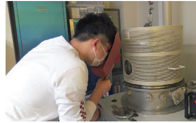
磁性微粒子に関する特別研究 Research projects related to magnetic particles

For the coexistence of the environment and development in the real world, the students who belong to the electrical and electronic system course are required to enhance their problem-solving ability through the practical curriculum with wider vision. To make a significant contribution toward a new industry standard, the curriculum contains not only the classes pertaining to leading-edge electrical and electronic technology but also the cross-disciplinary course works like Engineering Design Project and Research Project. In fact, the teachers instruct a wide range of academic fields from internet of things (IoT) technology for Industry 4.0 known as the fourth industrial revolution to large-scale smart grid system for environmental conservation. Moreover, since the students actively address their research themes from a variety of angles throughout two years, the teachers can cultivate the human resources with the ability and the energy. We strongly hope that our students bring diversity to the community and create positive change in the industrial society.